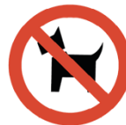
Haustiere aller Art