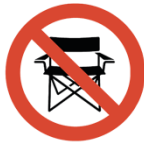
Sitzgelegenheiten, Campingstühle o.ä.