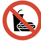
Speisen & Getränke