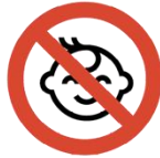
Kinder unter 6 Jahren erhalten keinen Zutritt