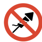
Pyrotechnik aller Art, Feuerwerk, Laserpointer o.ä.

Um einen reibungslosen und entspannten Ablauf für alle zu gewährleisten, lassen Sie gefährliche und untersagte Gegenstände aller Art zuhause.