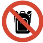
Rucksack & Taschen größer als DIN A4