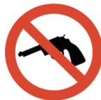
Waffen aller Art, Sprays, Wurfgeschosse o.ä.