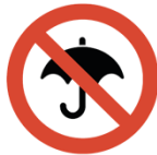
Stockschirme, Fahnenstangen o.ä.