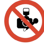
professionelle Kameras, Audio- und Videorekorder o.ä.